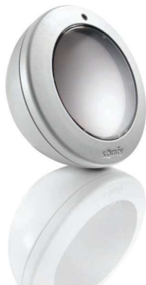
Sensor de Sol